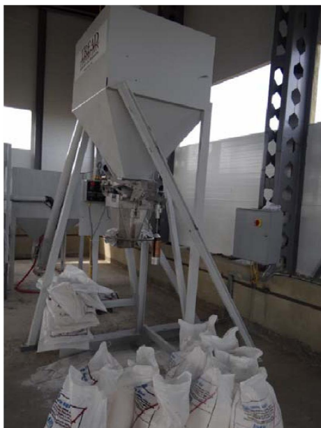
Рисунок 2 – Шнековая смешивательная установка «Т-1»

Жидкость полиметилсилоксановая в состоянии аэрозоля была введена в состав гранулированной аммиачной селитры марки «Б» по ГОСТ 2-2013 производства АО «СДС Азот», РФ при ее шнековом перемешивании на установке типа «Т-1» в концентрации 10 мл/тону.