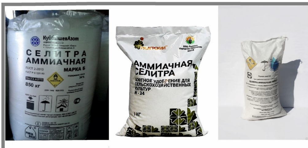
Рисунок 1 - Товарный вид упакованной аммиачной селитры

Таким образом, разработка и практическое применение методов маркирования (мечения) [11, 12] гранулированной аммиачной селитры, с целью ее последующей идентификации как «прекурсора взрывчатых веществ» является актуальным и перспективным направлением в современной химии [13 - 19].